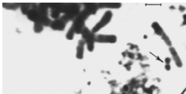
Рис. 3. Фрагмент метафазной пластинки ели сибирской (автовокзал «Взлетка») с В-хромосомой — 2n = 24 + 1В . Об. 90х, ок. 10х. Масштабная линейка 5 мкм